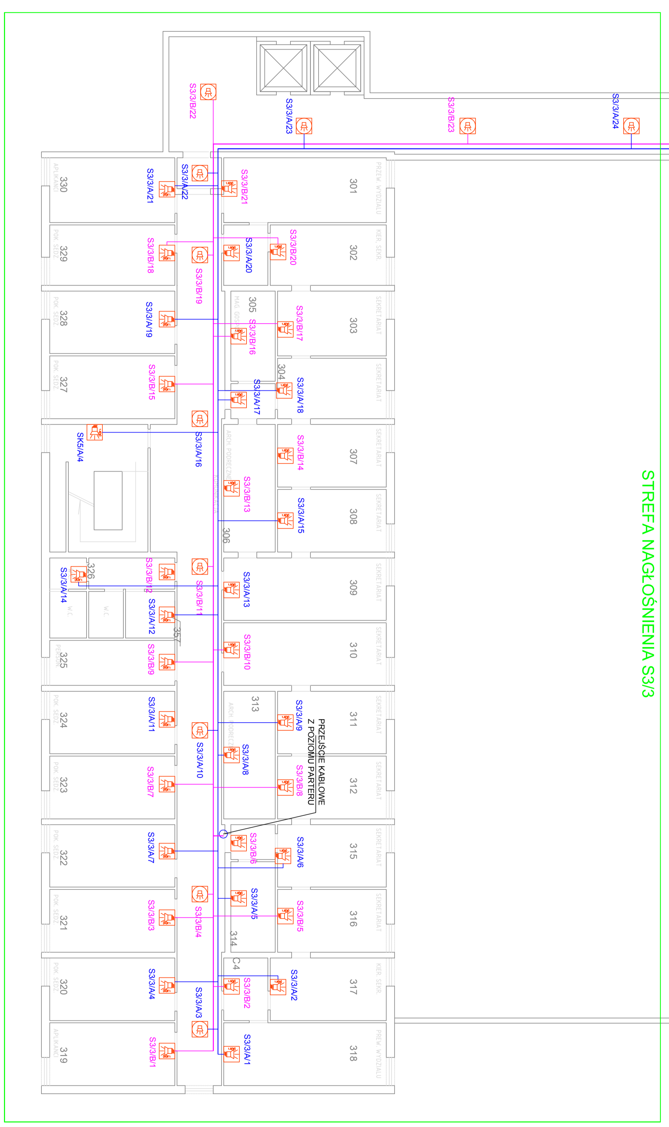
STREFA NAĞŁOŚNIENIA S3/3

UMIĄCZ: 1. Przewody i kabły elektryczne oraz szafki rozdzielcze wraz z ich wyposażeniem należy zamontować zgodnie z projektem i zgodnie z instrukcją producenta. W przypadku montażu przewodów należy stosować odpowiednie zabezpieczenia mechaniczne i elektryczne. W przypadku montażu szafek rozdzielczych należy stosować odpowiednie zabezpieczenia mechaniczne i elektryczne. W przypadku montażu przewodów należy stosować odpowiednie zabezpieczenia mechaniczne i elektryczne. W przypadku montażu szafek rozdzielczych należy stosować odpowiednie zabezpieczenia mechaniczne i elektryczne.